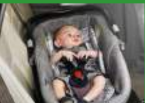
Автокресло «люлька» группы 0 (для детей массой < 10 кг)*

При покупке детского удерживающего устройства обязательно следует уточнить у продавца наличие сертификата на товар!